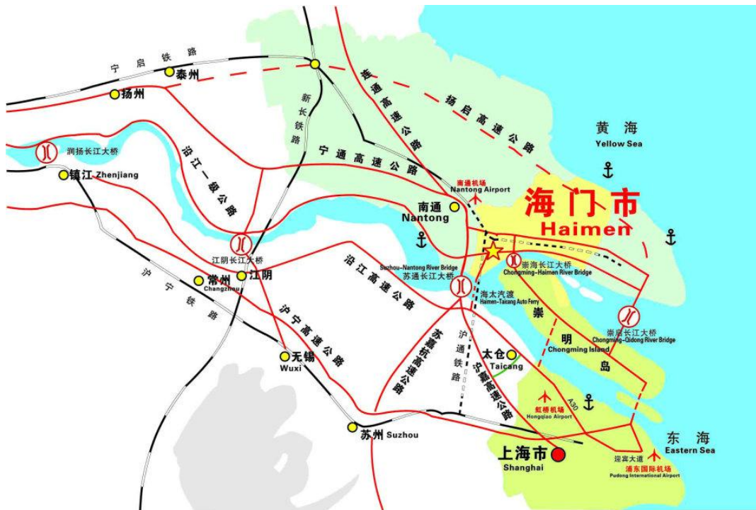
图 1-1 海门区地理位置图